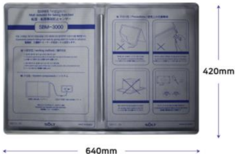
マット検知センサー(センサー/マットパーツ)